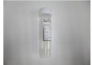
※3日間の痰を採取します。

痰の中に含まれる細胞を顕微鏡で確認し、異形変化がないかを調べる検査です。 肺がんだけでなく、アレルギー・喘息などの炎症性変化も発見できます。